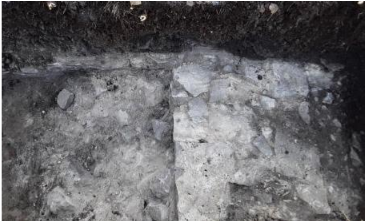
Edward Malloch House