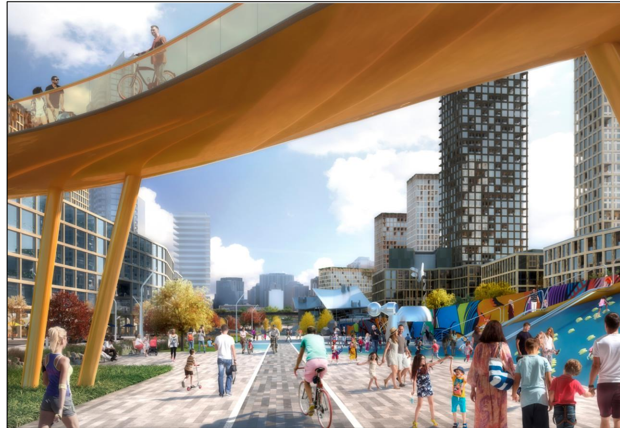
Planned: Preston Pedestrian and Cycling Bridge Prévu: Pont pour piétons et cyclistes de Preston