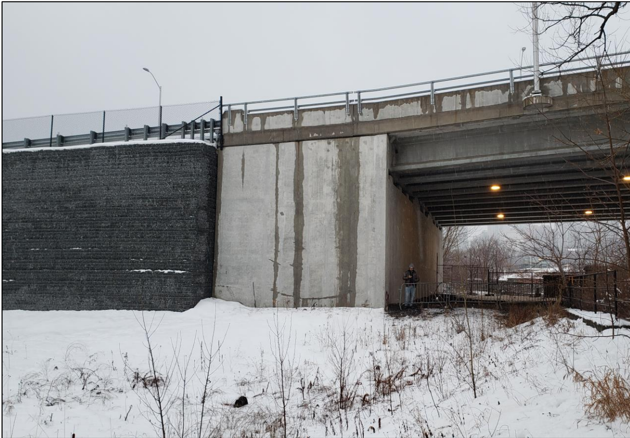
Existing: Booth Street Bridge Existant: Pont de la rue Booth