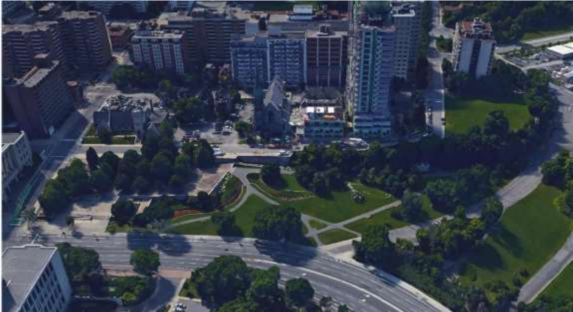
On pensait que la parcelle de quatre acres qui allait devenir le Jardin des provinces et des territoires était impropre à la construction d'édifices : elle avait été utilisée pour des écuries et par un entrepreneur de pompes funèbres, et Jacques Gréber la trouvait dégradée. Elle était toutefois un lien important dans la capitale, un point d'entrée au centre-ville par la promenade de l'Ouest et un contrepoint au Monument commémoratif de guerre du Canada. Étant l'un des rares aménagements paysagers de grande qualité du début des années 1960 à subsister — à Ottawa et même dans le monde — il a été un bon exemple lors de la séance « La sauvegarde du moderne dans la capitale » de mai 2015.