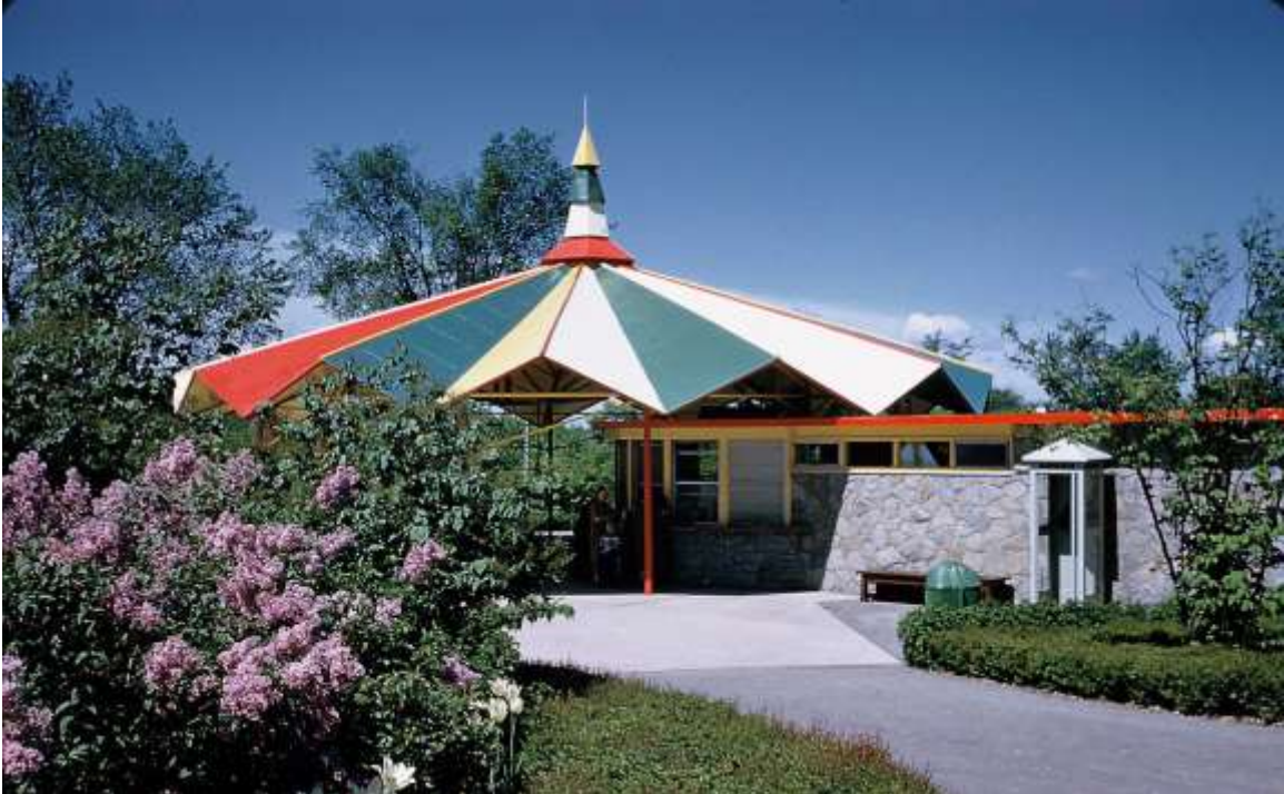
Pavillon Vincent Massey au parc Hog's Back: structures conçues par Hart Massey qui s'inspirent du lieu et de l'époque : ces bâtiments reflètent très habilement leur milieu d'insertion. Ce sont les composantes du paysage qui tissent ensemble les principaux éléments du milieu bâti. Un excellent exemple de la confiance qui caractérise la vie et l'architecture des années cinquante.